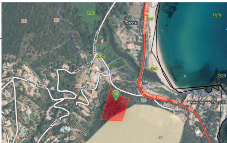
Conca, le projet contrevient à la loi Littoral et au Padduc. Donc inconstructible.

Conca (Favona) - Le préfet de Corse du Sud a obtenu le 14 février, la suspension de l'exécution de l'arrêté du 28 août 2023 du maire de Conca transférant un permis de construire une maison sur un terrain situé à Favona au lotissement Punta di Mare.