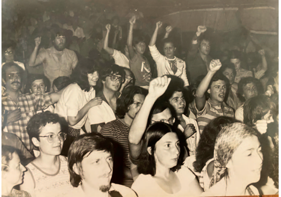
■ A giuventù corsa hè sempre stata à l'apputamenti di a storia.

Pendant ce temps, l'UPC affaibli à la fin des années 1990 a fusionné avec un mouvement issu de la LLN qui a justement fait son aggiornamento , Scelta Nova, puis avec un autre également issu de la LLN, Mossa Naziunale... pour former à l'orée des années 2000 le Partitu di a Nazione Corsa avec en fond de discours l'idée d'un grand parti démocratique à tendances. Les jeunes sont séduits. D'autant que le fond idéologique aussi a évolué, en communiquant mieux sur la notion d'autodétermina-