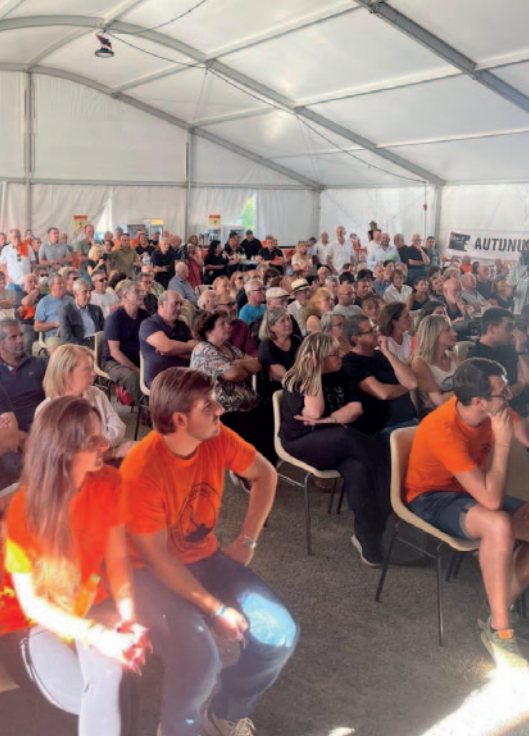
■ Una voglia d'impegnassi pè à Corsica.

tous ceux qui s'investissent dans la vie économique et sont exposés au racket ? Il ne faut surtout pas que ces angoisses nous conduisent à l'immobilisme. Il faut créer une dynamique positive en mettant en avant les jeunes qui s'inscrivent dans des parcours vertueux, et surtout, faire en sorte que ceux dont les comportements sont marginaux soient véritablement, et définitivement renvoyés dans la marge de la société.