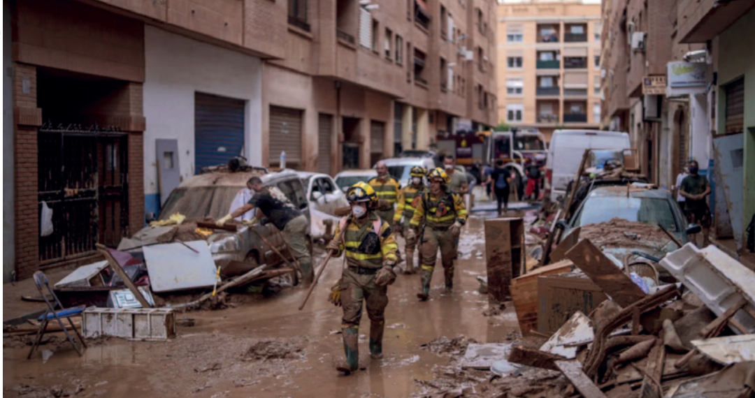
Octobre 2024. Le sud est de l'Espagne vit les pires inondations depuis plus de cinquante ans dans le pays.