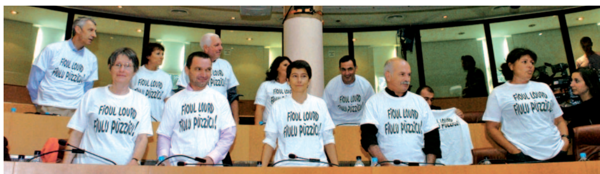
Action du groupe Femu a Corsica, alors dans l'opposition à l'Assemblée de Corse, en 2010.