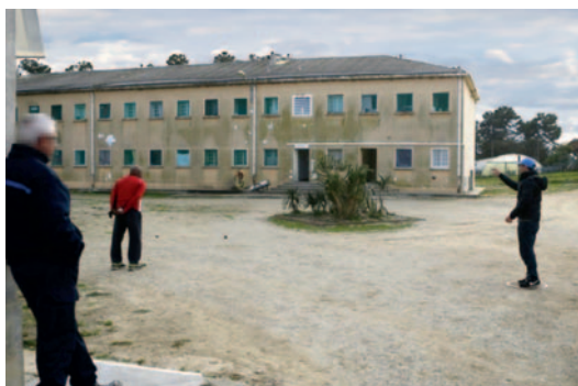
L'agent est déclaré apte au travail en milieu ouvert. Casabianda est tout indiqué !