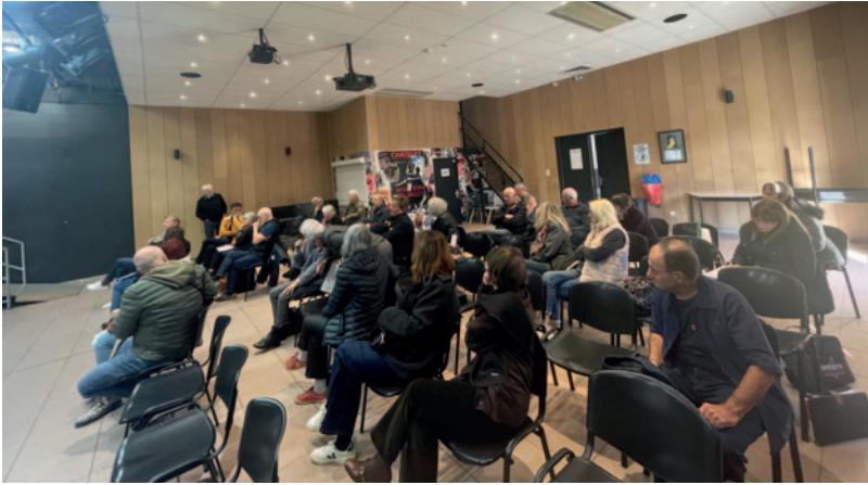
Un public attentif et participatif.