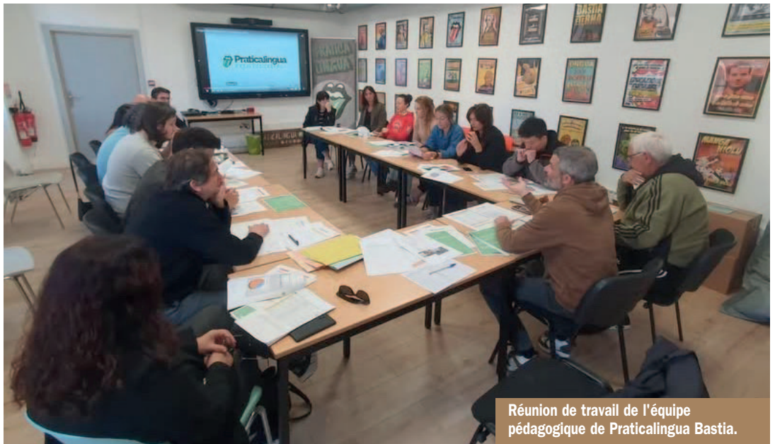
Réunion de travail de l'équipe pédagogique de Praticalingua Bastia.

La vie associative n'est pas de tout repos mais elle est passionnante ! La crise de la Covid n'a pas eu raison de nous et nous avons su maintenir notre activité grâce aux nouvelles technologies sans réellement perdre le contact avec la population. Les projets abondent, notamment culturels sur le pourtour du bassin méditerranéen (avec la Catalogne, la Sicile, la Sardaigne...) mais aussi technologiques (sur l'intelligence artificielle linguistique). Nous proposons des livres à l'achat ( Cum'ella parla Bastia et Praticaffissi ), un grand nombre de goodies (des mugs pop, des affiches, des t-shirts, des casquettes...) qui nous permettent aussi d'alimenter l'économie de l'association tout en amenant un côté coloré, parfois iconoclaste, à la transmission de la langue corse. Toujours avec respect mais avec le souci de souligner la modernité absolue de la langue. Au niveau humain, Praticalingua est une communauté humaine solide qui s'élargit, tant au niveau des chargés d'animation que des adhérents. Nous sommes en croissance chaque année, doucement mais sûrement, couvrant l'ensemble du territoire (notamment par le biais du programme Casa di e lingue de la Collectivité de Corse que nous assumons avec d'autres associations